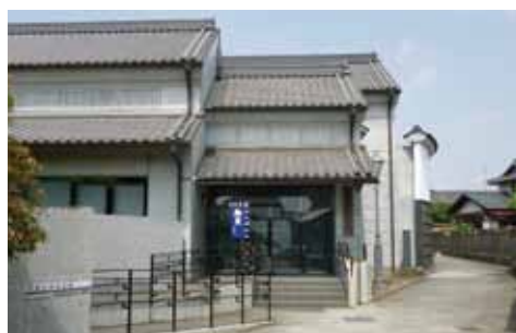
伊能忠敬記念館 ㊤香取市佐原イ1722-1

川崎・西新井とともに日本厄除三大師に数えられ、古くから多くの信者を集めています。境内には、本堂のほか5つの堂を構え、四季折々の景観の美しさも知られています。