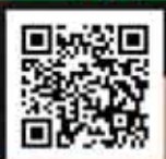
▲スポーツエントリー