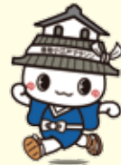
大会マスコットキャラクター かとまる