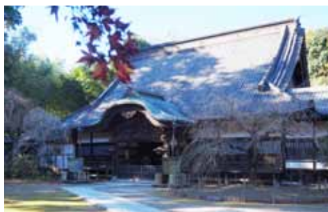
観福寺 ㊤香取市牧野1752

明治時代以前に伊勢と香取、鹿島にのみ与えられていた神宮の称号をもつ国内屈指の名社です。玉砂利の長い参道、幹周り3mを越す巨木が立ち並び境内は神秘的な景観です。