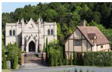
聖フランシスコ教会 ㊤香取市篠原イ987-1

英国式教会に英国の教会から譲り受けたパイプオルガンやマリア像が配されています。教会前には英国から移築した民家もあります。レンタルスペースとしての利用のほか、結婚式を挙げることもできます。