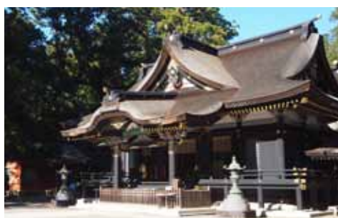
香取神宮 ㊤香取市香取1697-1

明治時代以前に伊勢と香取、鹿島にのみ与えられていた神宮の称号をもつ国内屈指の名社です。玉砂利の長い参道、幹周り3mを越す巨木が立ち並び境内は神秘的な景観です。